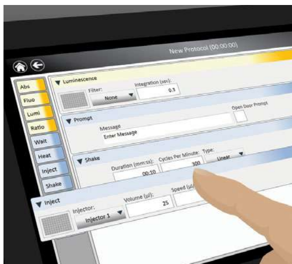
Figure 4. Drag and Drop Protocols.