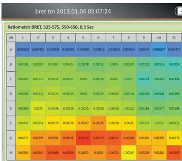
Figure 3. Heat Map Display.